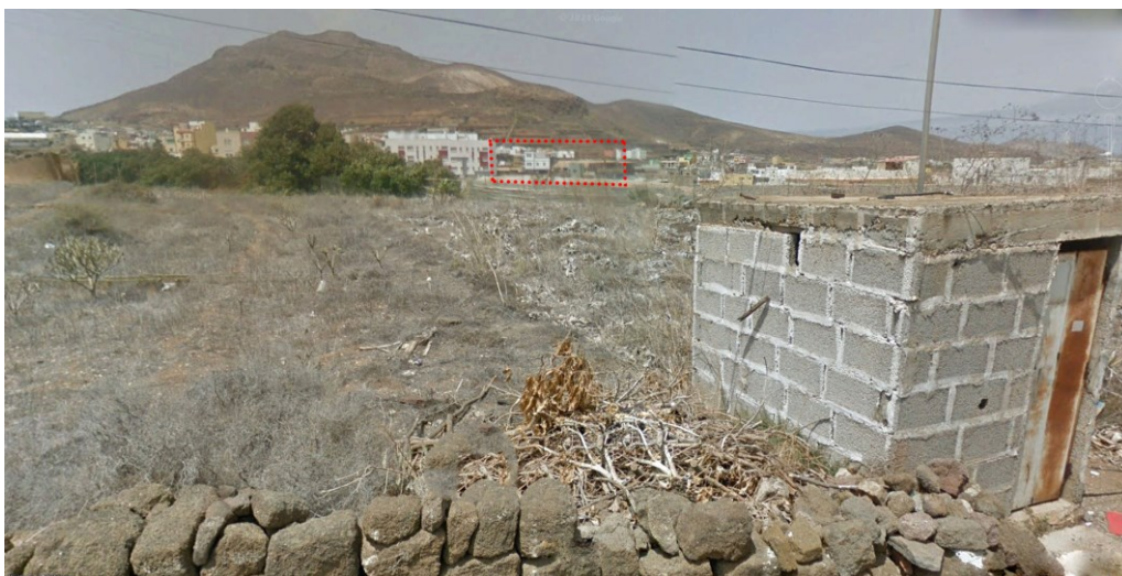
Visual desde el punto de observación 3.