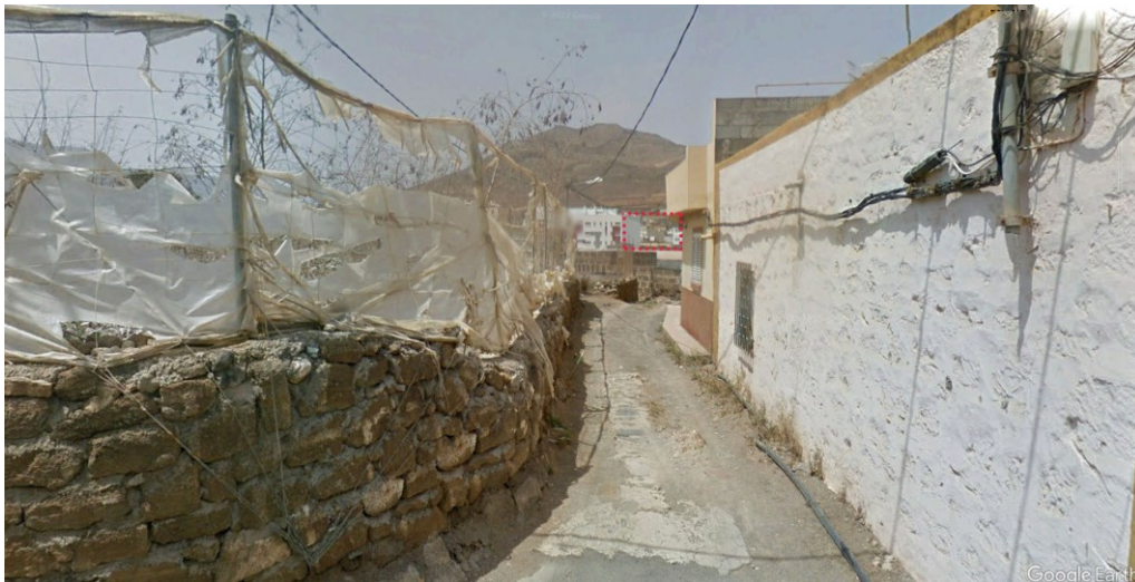
Visual desde el punto de observación 2.