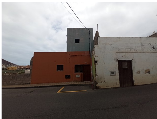
Vivienda 2. Estrechamiento producido por la vivienda 1.