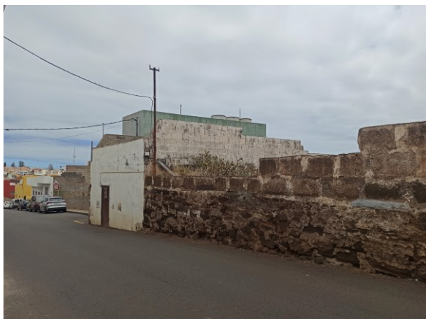
Vivienda 1 y muro del estanque.

Tanto el estanque, como la edificación ubicada junto a él, se encuentran fuera de la alineación oficial. La edificación es de una planta, y presenta un regular estado de conservación, con los volúmenes traseros sin tratar en cuanto a acabados, presentando el bloque visto.