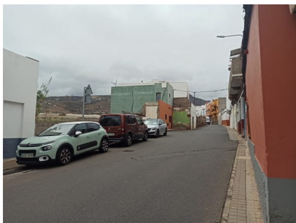
Vista de la fachada afectada por la MM en sentido sur.