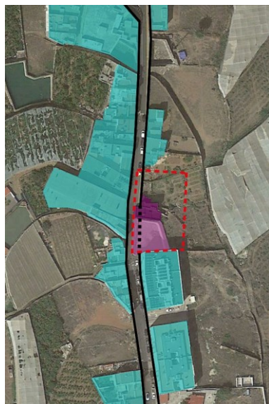
Alineaciones y colmatación de la trama.

APROBACIÓN INICIAL ANÁLISIS DE INTEGRACIÓN PAISAJÍSTICA