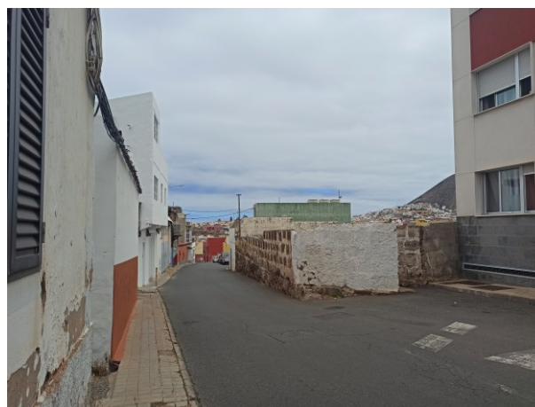
Vista de la fachada afectada por la MM en sentido norte.

El elemento más significativo del área afectada por la MM es la situación de fuera de alineación de parte de las fincas, que producen un estrechamiento en el viario impidiendo el normal tránsito de vehículos y personas. La gestión del tránsito en este punto de la vía recae en los propios conductores que deben alternar ambos sentidos del tráfico en una situación de reducida visibilidad.