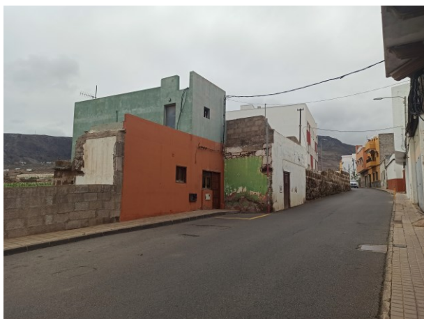
Vivienda 2, en su encuentro con la vivienda 1.

La otra edificación existente sí mantiene su fachada sobre la alineación oficial. Se trata de una edificación de dos plantas, con aparente buen estado de conservación, aunque también presenta algunos volúmenes traseros con sus paramentos sin tratar.