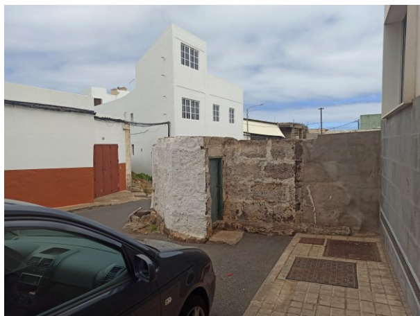
Muro del estanque en su extremo sur, fuera de alineación.

La otra edificación existente sí mantiene su fachada sobre la alineación oficial. Se trata de una edificación de dos plantas, con aparente buen estado de conservación, aunque también presenta algunos volúmenes traseros con sus paramentos sin tratar.