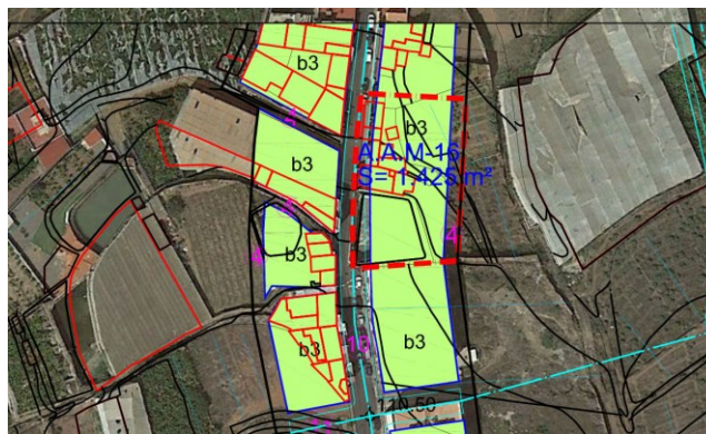
Ordenación pormenorizada del PGO de Gáldar.

El área se presenta sin edificaciones en su mayor parte, a excepción de un estanque y dos edificaciones junto a él. Precisamente son estas edificaciones y el estanque las que no mantienen la alineación del viario, generando un estrechamiento en este que es el detonante de esta MM.