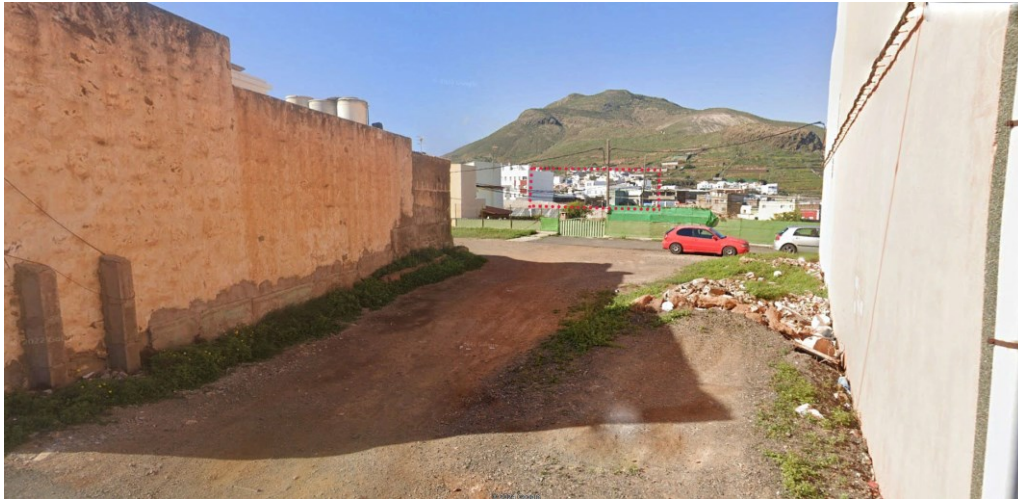
Visual desde el punto de observación 1.

APROBACIÓN INICIAL ANÁLISIS DE INTEGRACIÓN PAISAJÍSTICA