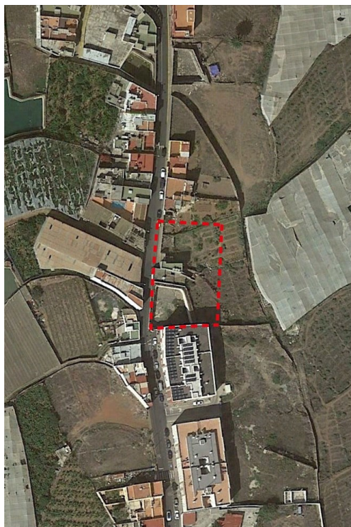
Área de alteración del planeamiento.

El ámbito objeto de la presente Modificación Menor es la A.A. Marmolejo M-16 , que se localiza en el municipio de Gáldar, en el barrio del mismo nombre.